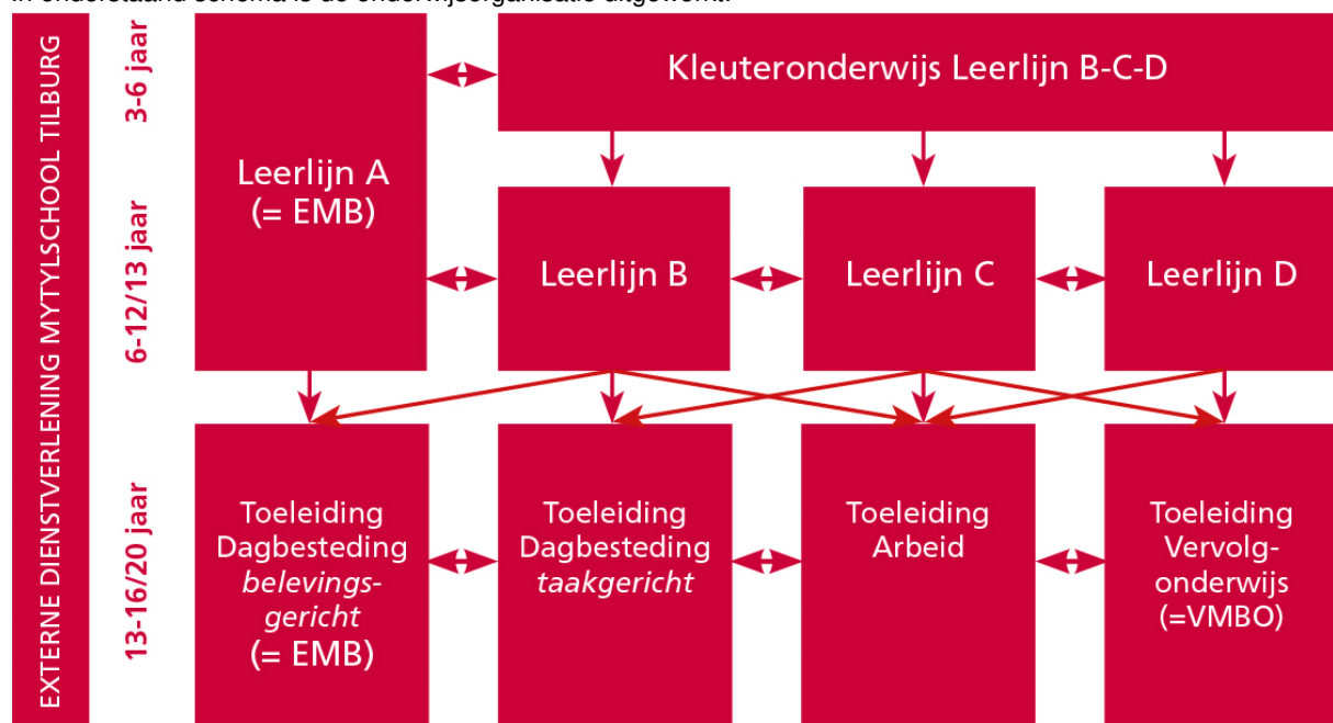
Figuur 1 Onderwijsorganisatie

In onderstaand schema is de onderwijsorganisatie uitgewerkt: