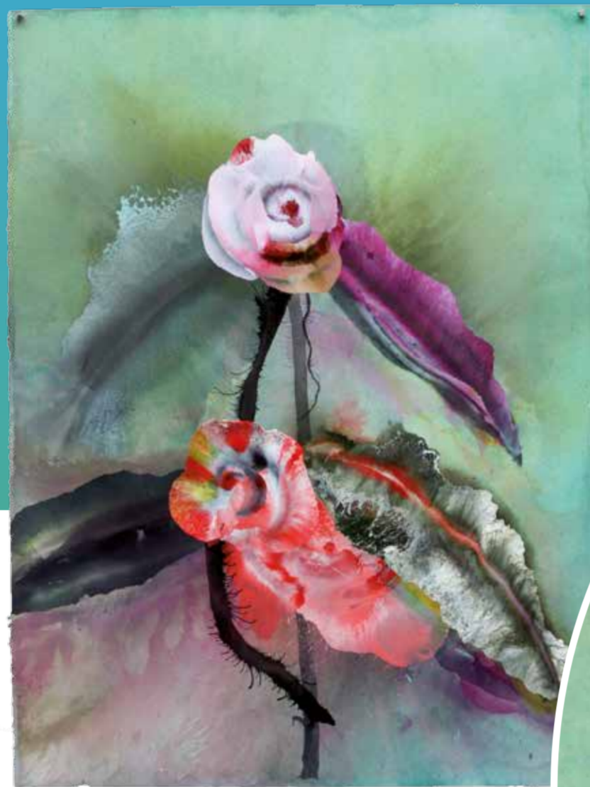
Reinoud van Vught

Reinoud van Vught exposeerde onder andere in museum De Pont, het Cobra Museum en Chabot Museum. Zie ook www.reinoudvanvught.nl